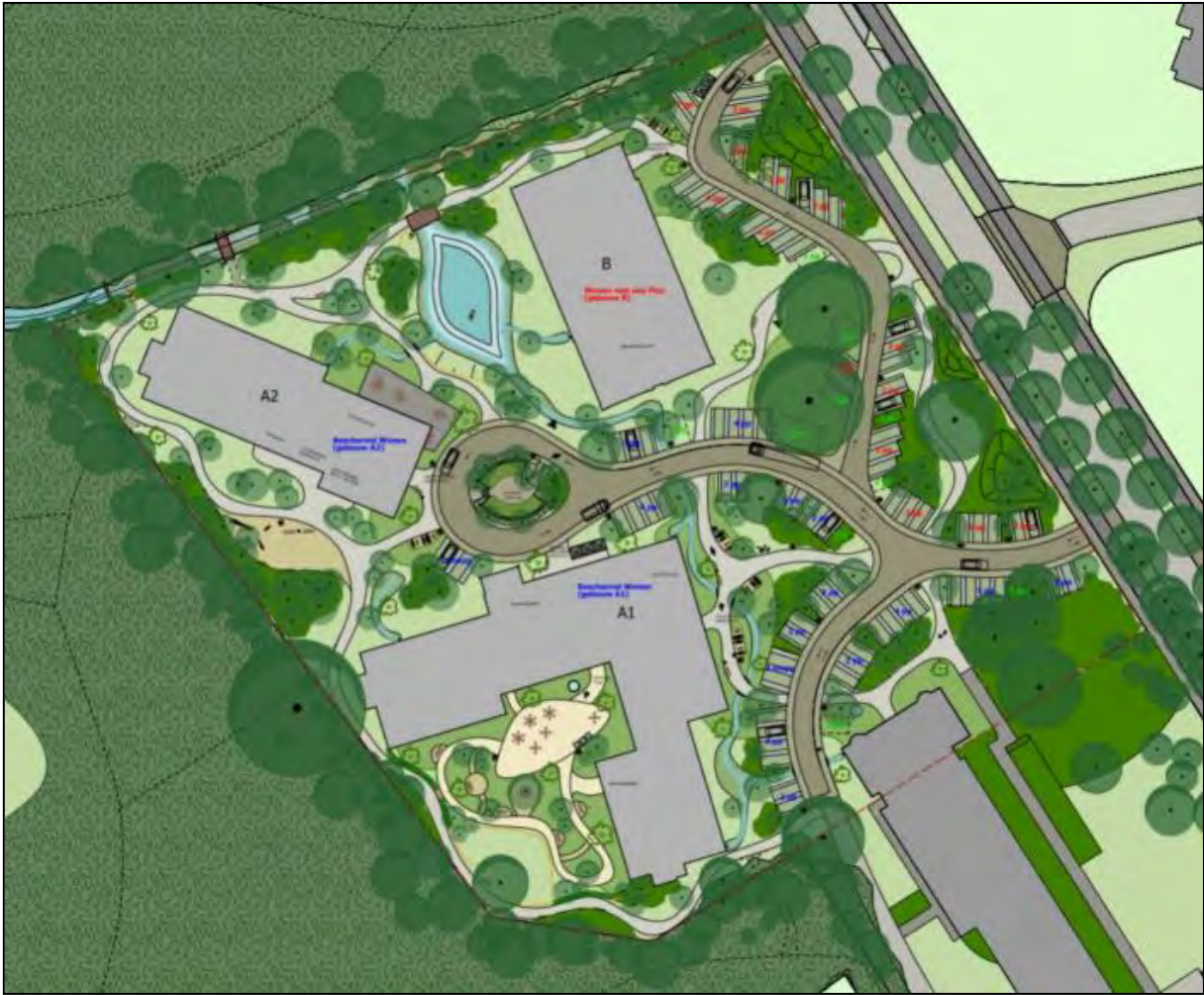
Figuur 2: Stedenbouwkundig inrichtingsplan toekomstige situatie