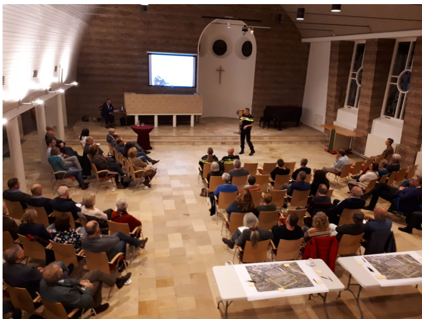
Foto van de openbare startbijeenkomst op 4 november 2019

Er waren circa 80 mensen aanwezig. Op deze avond werd het participatietraject toegelicht en een presentatie gegeven over de Politieacademie en de inpassing van de Politieacademie op het terrein Almata. Geïnteresseerden konden zich inschrijven voor de werkgroep, waarbij is aangegeven dat de politie, in samenwerking met de gemeente, de definitieve werkgroep van maximaal 15 personen samenstelt. Ook kon men een mailadres achterlaten om gedurende het traject op de hoogte te worden gehouden. Wanneer verslagen van de bijeenkomsten op de projectwebsite www.zeist.nl/almata werden geplaatst, kreeg men een emailbericht ter notificatie. Tot slot konden de aanwezigen opmerkingen, wensen en suggesties voor Almata meegeven, als huiswerk voor de werkgroep. Dit kon ter plekke of via het digitale reactieformulier op de projectwebsite. Het verslag van de avond is als bijlage bijgesloten.