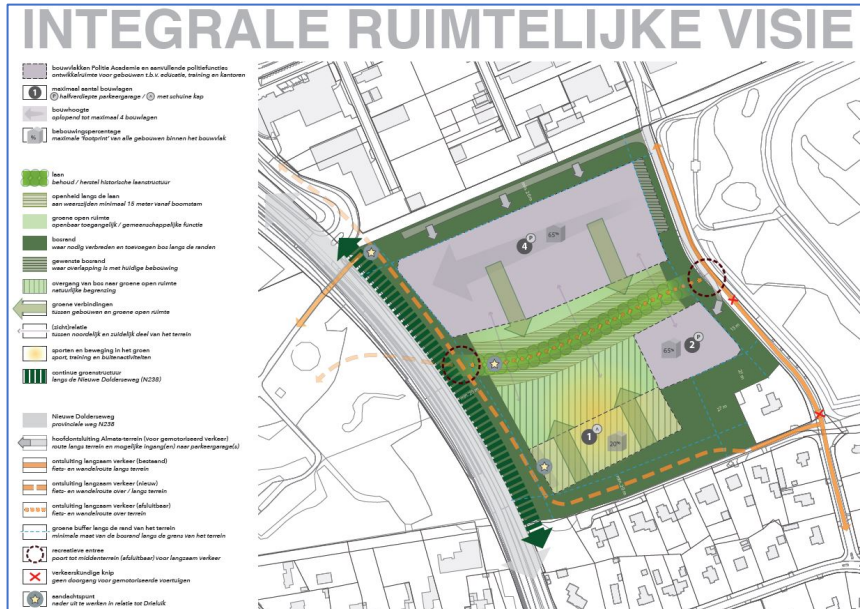
Kaart met de Integrale Ruimtelijke Visie