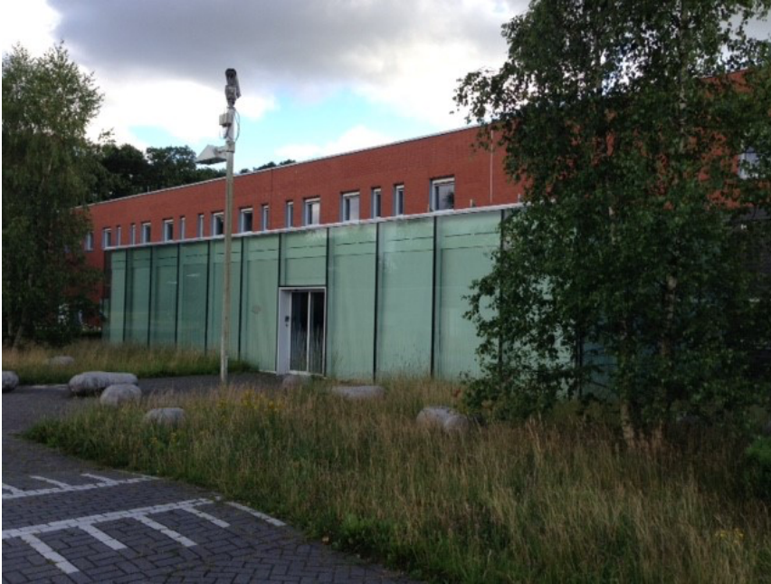
Foto van de ingang van de voormalige jeugdgevangenis