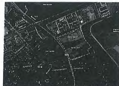
afbeelding 1: Locatie Almata in Den Dolder

De locatie bevindt zich ten oosten van de dorpskern van Den Dolder en is gunstig gelegen langs de uitvalsweg N238. Daarnaast bevindt het treinstation van Den Dolder zich op loopafstand van de locatie (ca. 1 km).