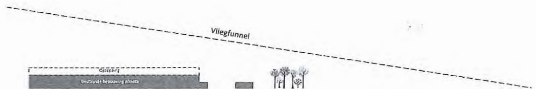
afbeelding 3: Vliegfunnel Soesterberg en optoppingswens Politie (indicatief)