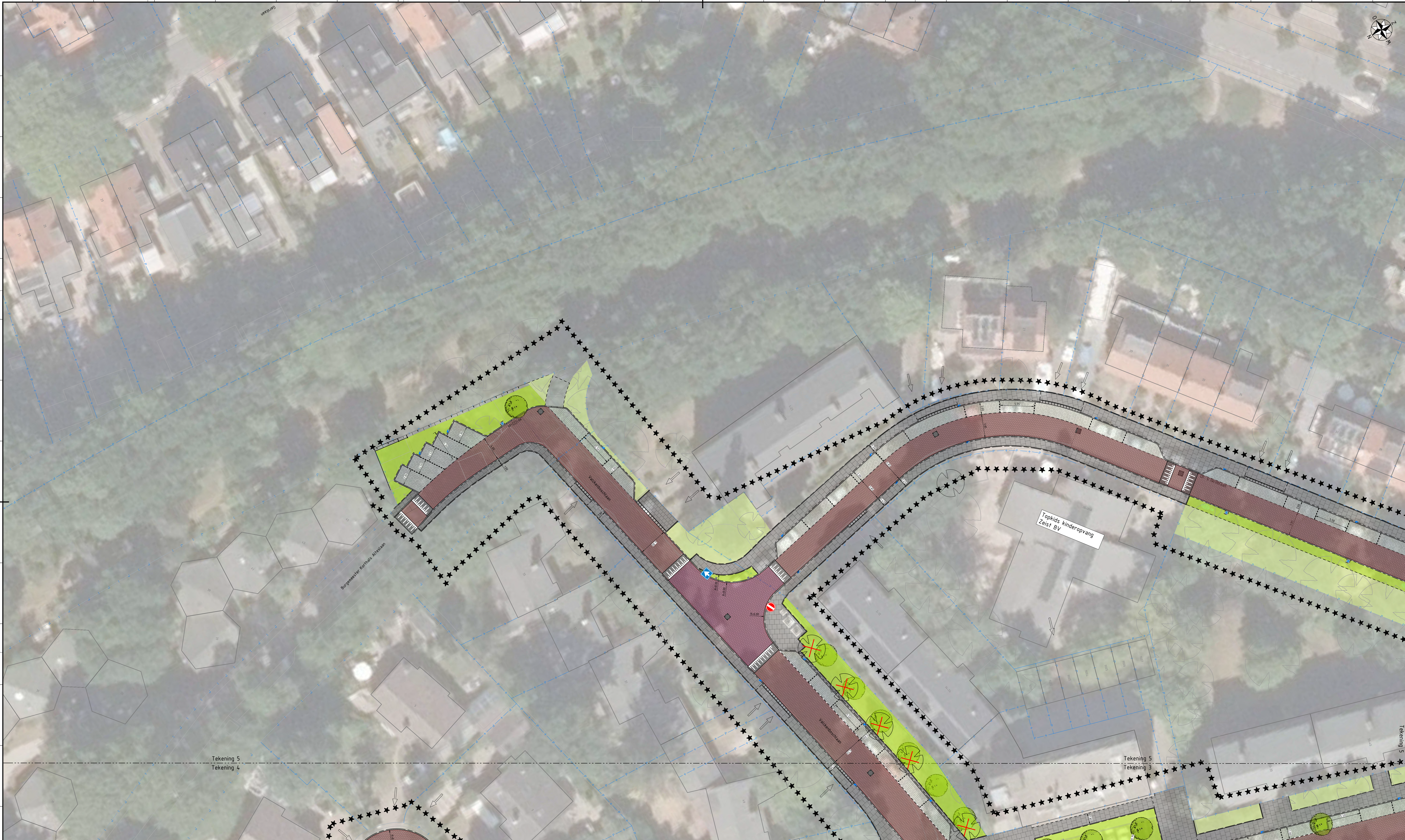
Tekening 5 Schaal 1:200