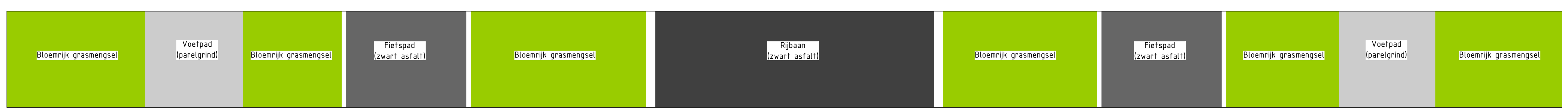
Profiel B-B Schaal 1:50