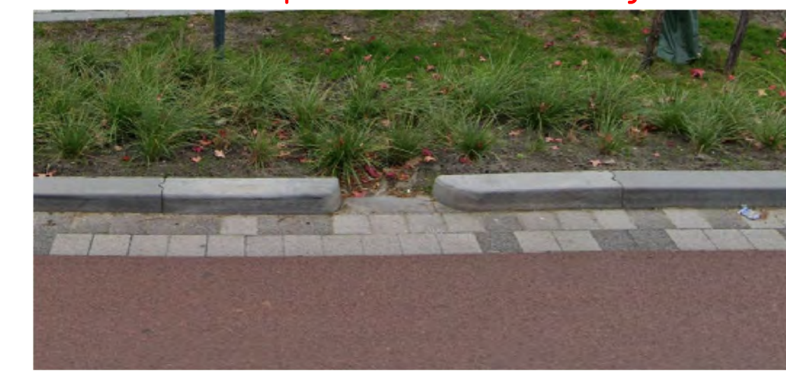
1. Principe waterafvoer rijbaan