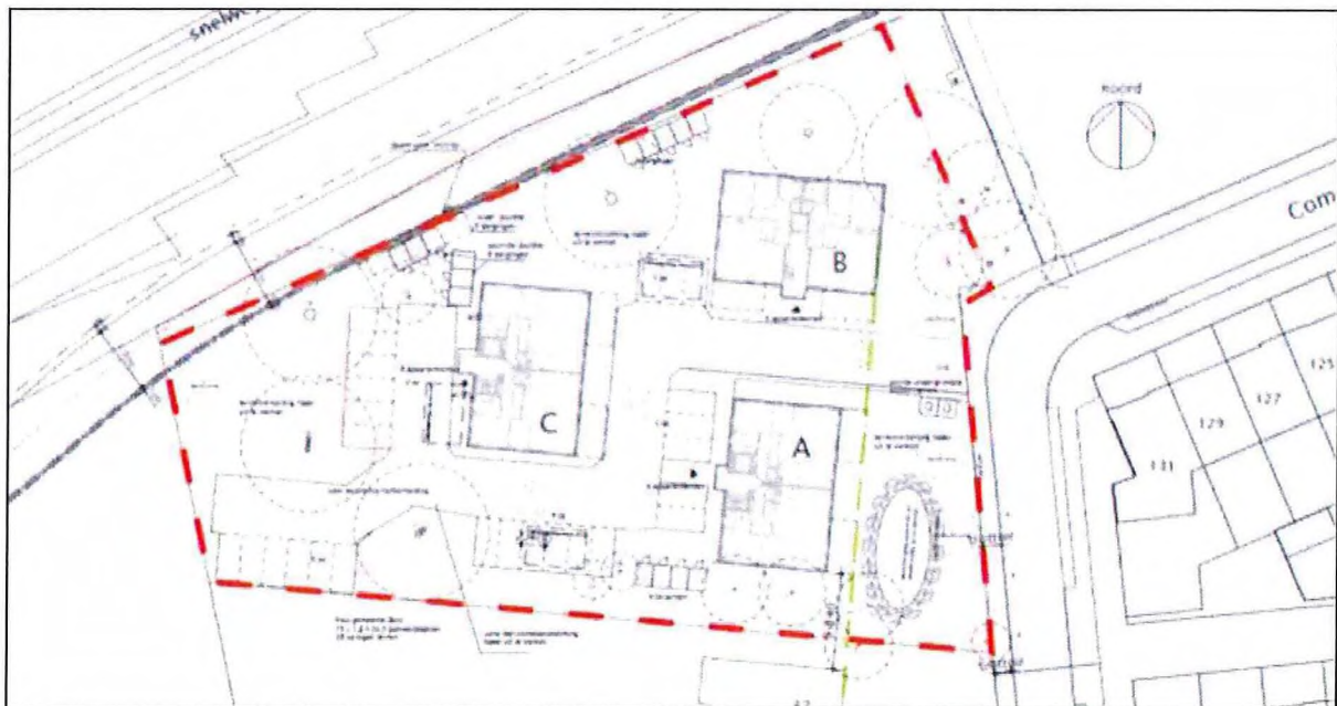
Figuur 2: Situatietekening gewenste situatie met naamgeving gebouwen