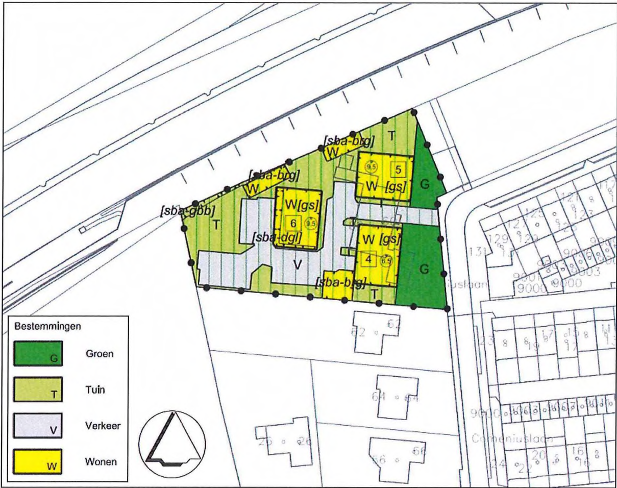
Figuur 1: Uitsnede plankaart